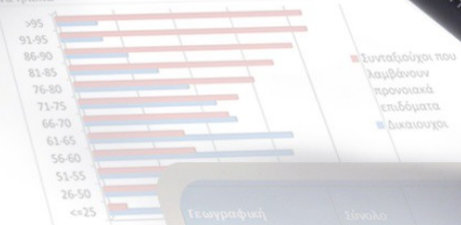
Διάγραμμα 7: Ποσοστιαία