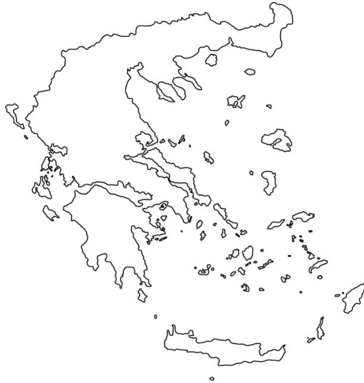
Χάρτης 2: Κατανομή Δικαιούχων Προνοιακών Επιδομάτων ανά Περιφέρεια