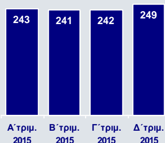
Λειτουργικά Έξοδα (€εκ.)

Τα οργανικά κέρδη προ προβλέψεων αυξήθηκαν σε €188εκ. 3 το Δ' τρίμηνο, σε σχέση με €166εκ. το Γ' τρίμηνο, ενώ τα συνολικά κέρδη προ προβλέψεων υποχώρησαν σε €181εκ. 3 , από €219εκ. το Γ' τρίμηνο, λόγω ζημιών από τα χρηματοοικονομικά έσοδα.