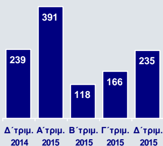
Νέα Δάνεια σε Καθυστέρηση άνω των 90 ημερών (€εκ.)

Παράλληλα, σημαντική αύξηση κατά €643εκ. κατέγραψαν οι καταθέσεις πελατών στην Ελλάδα, ενώ σε επίπεδο Ομίλου η αύξηση ανήλθε συνολικά σε €1,4δισ. σε τριμηνιαία βάση, ως αποτέλεσμα και της προσέλκυσης νέων καταθέσεων στο εξωτερικό. Η αύξηση των καταθέσεων και η διενέργεια συμφωνιών Repos στη διατραπεζική αγορά συνετέλεσαν στη μείωση της χρηματοδότησης από το ευρωσύστημα σε €24,3δισ. στο τέλος Φεβρουαρίου 2016, από €31,6δισ. στο τέλος Σεπτεμβρίου 2015.