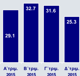
Χρηματοδότηση από το Ευρωσύστημα (€δισ.)

Το Δ΄ τρίμηνο 2015 αποτέλεσε μια περίοδο θετικών εξελίξεων για τη Eurobank, καθώς ολοκληρώθηκε με επιτυχία η ανακεφαλαιοποίηση της Τράπεζας κατά €2,0δισ., με αποκλειστική συμμετοχή κεφαλαίων από την αγορά, ενώ παράλληλα σημειώθηκε σημαντική εισροή καταθέσεων, η οποία συνετέλεσε στη μείωση της χρηματοδότησης από το ευρωσύστημα.