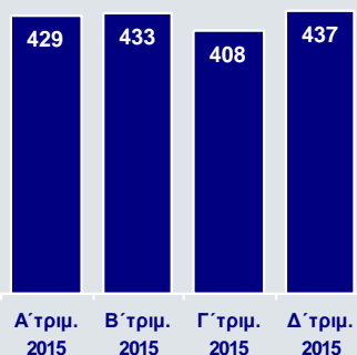
Οργανικά Έσοδα (€εκ.)

Τα οργανικά έσοδα ενισχύθηκαν κατά 7,2% έναντι του Γ' τριμήνου και διαμορφώθηκαν σε €437εκ., ενώ τα συνολικά έσοδα υποχώρησαν κατά 6,9% σε €430εκ., καθώς τα χρηματοοικονομικά και λοιπά έσοδα ήταν αρνητικά κατά €8εκ., έναντι κερδών €54εκ. το Γ' τρίμηνο.