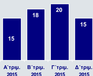
Καθαρά Επαναλαμβανόμενα Κέρδη Δραστηριοτήτων Εξωτερικού (€εκ.)

Οι δραστηριότητες στο εξωτερικό κατέγραψαν αξιοσημείωτες επιδόσεις, καθώς για πρώτη φορά μετά το 2011 επιτεύχθηκαν κέρδη σε ετήσια βάση. Ειδικότερα, τα καθαρά επαναλαμβανόμενα κέρδη διαμορφώθηκαν σε €67εκ. το 2015, έναντι ζημιών ύψους €182εκ. το 2014, με τα κέρδη το Δ' τρίμηνο να ανέρχονται σε €15εκ.